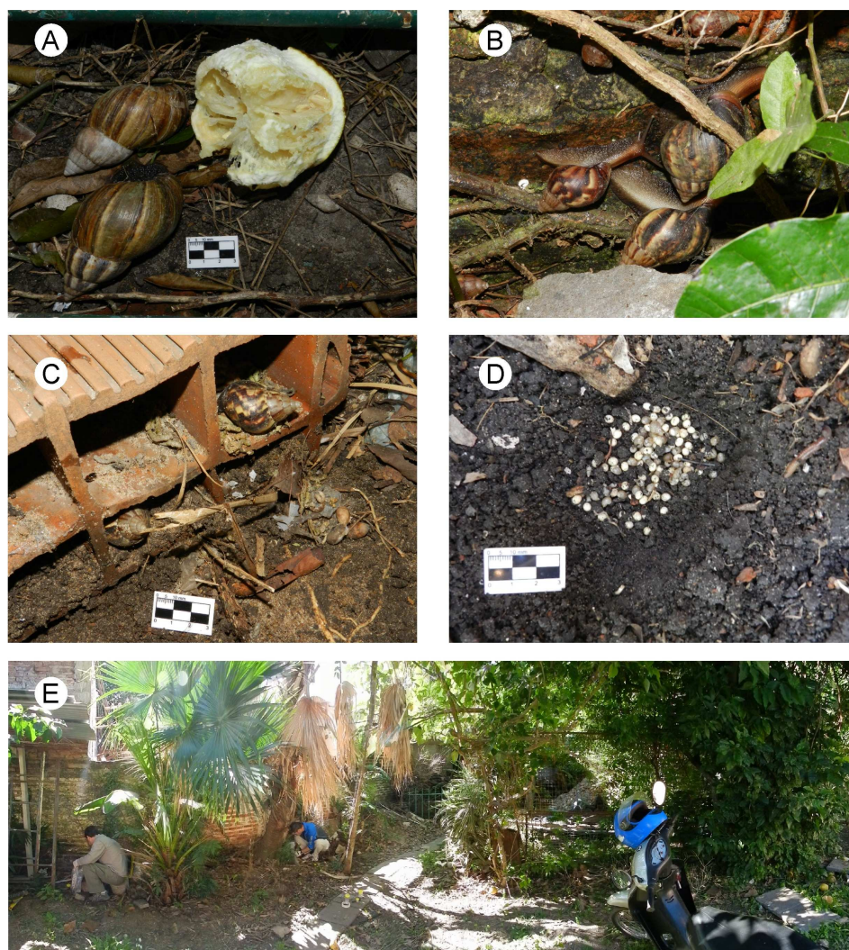
Figura 2. Ejemplares de Achatina fulica registrados en la localidad de Corrientes (Argentina). A: Alimentándose de cítricos; B: Sobre una pared húmeda, en actividad diurna; C: Refugiados en ladrillos huecos; D: Una ovada en la parcela 1 (húmeda); E: Foto panorámica (180°) mostrando el sitio de muestreo.

para el sur de Sudamérica (Vogler et al. , 2013), este hallazgo se ubica precisamente dentro de una de las áreas de mayor susceptibilidad a ser invadida por el caracol gigante africano (zona argentina limítrofe a los ríos Paraná y Paraguay). Sobre la base de la evidente dispersión de esta agresiva especie invasora y la información de riesgo de invasión con la que se cuenta (Vogler et al. , 2013), validada en parte a partir de este nuevo registro, se enfatiza la necesidad de que los organismos de aplicación locales, regionales y nacionales, realicen el monitoreo y los controles pertinentes, sobre todo en zonas limítrofes, a los efectos de detener la expansión de esta especie invasora.